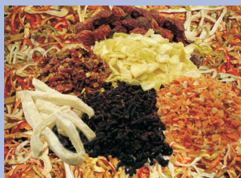
Сушка овощей, фруктов, грибов, ягод, трав