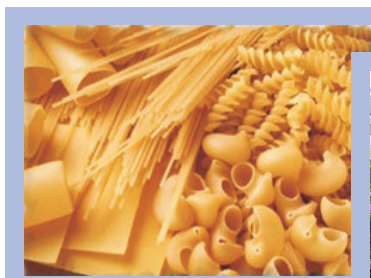
Сушка макаронных изделий